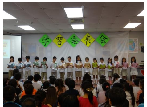
【エルフに、「ずうっと、大すきだよ。」って、いって…小1】

展示発表はいかがだったでしょうか。この一年間に子ども達が仕上げた作品の展示は、子どもの成長をよく表していました。舞台発表で使ったパネルの展示も、近くで見ると力作揃いだということがよく分かりました。それぞれに素晴らしい発表でした。