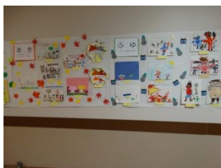
【幼稚園「一年間のあゆみ」