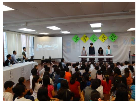
【“放送事故！”でも見事に対処…中1】