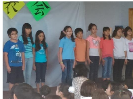
【トップバッターで堂々とした発表-小5】

“学芸会”から“学習発表会”になって3回目を迎えた今年度の発表会でした。保護者の皆様には子ども達への応援、励ましのため多数おいでいただき、ありがとうございました。ご覧いただいたとおり、子ども達は自分の持てる力を十分に発揮してくれました。いや、ひょっとするとそれ以上の力を出してくれたのかもしれませんが。講評の中でも述べましたが、舞台発表のリハーサルで見せていたときの様子と比べると、本番では段違いに集中力が増し、はっきりした発音で大きな声も出ていました。緊張していたことだと思います。緊張感の中で自分を奮い立たせることのできる—いわゆる“本番に強い”子ども達だなあと、つくづく感じました。