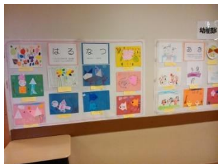
【幼稚部「一年間のあゆみ」

今年は展示を見る時間として昼休みを設定しましたが、観客が少なかったのが残念でした。来年はどうするのか検討します。