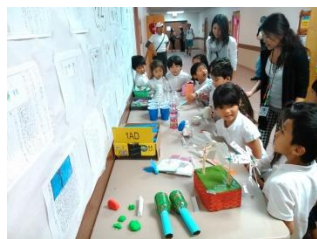
小2「おもちゃの作り方」