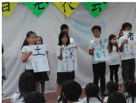
【自分の発表した漢字は忘れない！-小3】