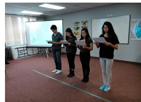
【堂々たる発表はさすが！-中3リハーサル】