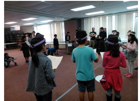
【何のお面でしょう？-小4リハーサル】