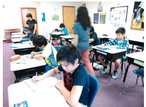
【姿勢良く、計算問題を解く子ども達(小4)】

姿勢が悪いと内蔵に悪影響があるとよく言われますが、姿勢は記憶力にも関係するという記事を読んだことがあります。それによると、「同じ姿勢をとる」ことは、体の「自伝的記憶力」（自分自身に関する記憶）に働きかけやすくなり、その記憶は長持ちするという事です。つまり何かを思い出している時、「学習した時の状態」も同時に思い出さるそうです。悪い姿勢で学習する習慣がついていけば、例えば試験の時にだけ良い姿勢で記憶を思い出そうとしても、思い出さず働きが妨げられてしまいます。ということは、うまく学習できていないこととなります。日頃からの学習に対する姿勢が影響します。ご家庭でも気をつけて下さい。