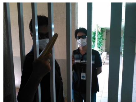
【①授業中に不審者侵入！】

運営委員会で話し合い、次回の避難訓練も不審者を想定しての訓練にすることにしました。今度は【Run-逃げる】ことを理解させたいと思います。