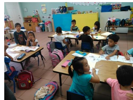
【②不審者侵入の連絡が！】